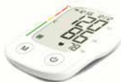
MISURA PRESSIONE DIGITALE