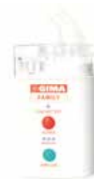
AEROSOL A ULTRASUONI