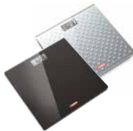
BILANCE IN VETRO