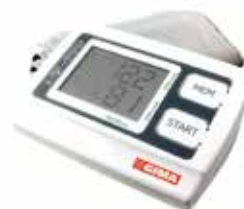
MISURA PRESSIONE DIGITALE