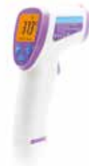
TERMOMETRO A INFRAROSSI