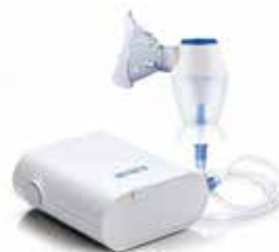
AEROSOL A PISTONE